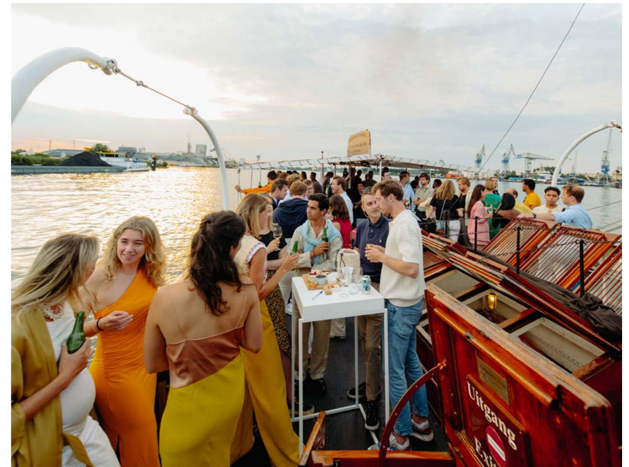
Zomerborrel Jong Compagnen

De Inspectie Overheidsinformatie en Erfgoed houdt toezicht op het beheer en het behoud van de Rijkscollecties. De afspraken hierover staan in de Regeling materieelbeheer museale voorwerpen. De Inspectie Overheidsinformatie en Erfgoed controleert of de beheerders van de rijkscollecties zich aan de afspraken houden.