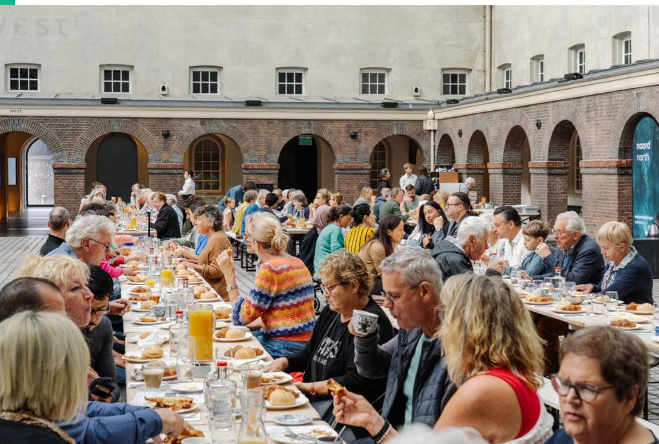
Thuishaven- buurtontbijt

2023 stond ook in het teken van verdere digitalisering van de collectie. Met een nieuwe fotostudio zijn er grote stappen gezet om de collectie zichtbaarder te maken, dit komt onder andere tot uiting in het digitaliseren van de technische tekeningen en de handschriftencollectie. Inmiddels is er meer dan 60% van de collectie gedigitaliseerd, geheel in lijn met de doelstellingen.