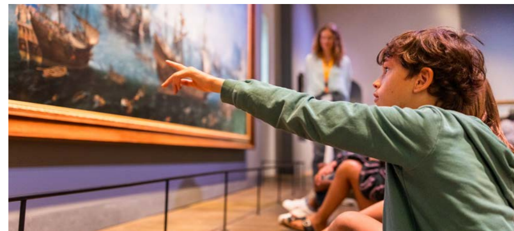
Schoolbezoek @ Twycer