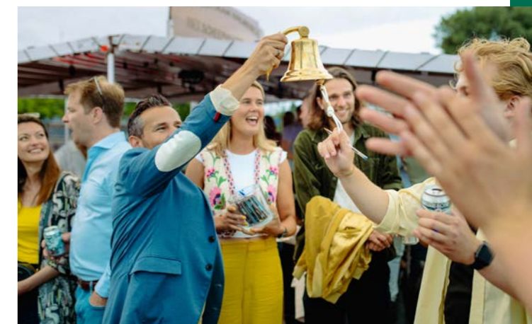
Zomerborrel Jonge Compaaenen