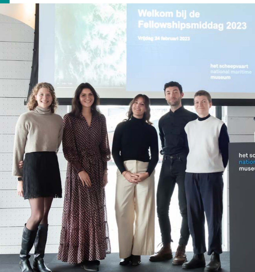
Fellowshipsmiddag @ Moniquekooijmans

De door InsingerGilissen berekende fee (ofwel bankkosten) voor het vermogensbeheer bedroeg € 32.174 (€ 36.815). Deze fee bedraagt 0,5% per jaar exclusief BTW gerelateerd aan de omvang van het belegde vermogen excl. liquide middelen. Het beheer van de portefeuille vindt plaats onder verantwoordelijkheid van het bestuur, in samenspraak met en onder controle van de Beleggingscommissie die bestaat uit een Commissaris, één bestuurslid (de penningmeester) plus drie leden van de VNHSM.