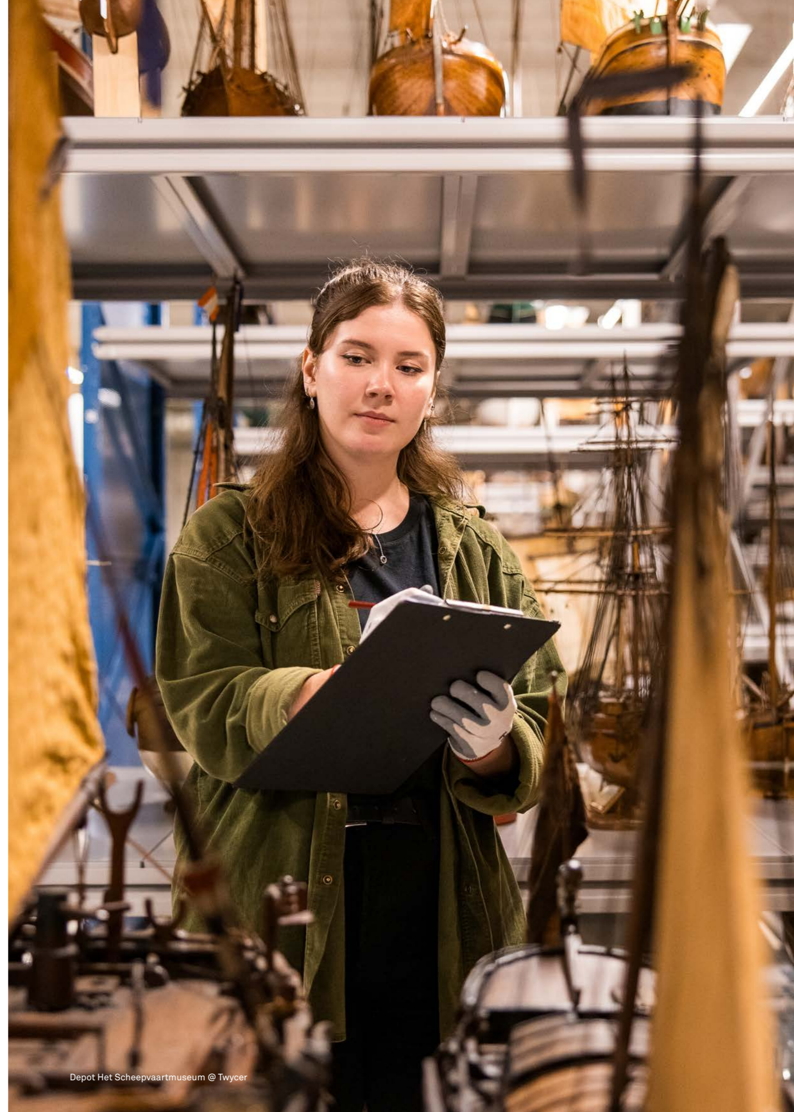
Depot Het Scheepvaartmuseum @ Twycer