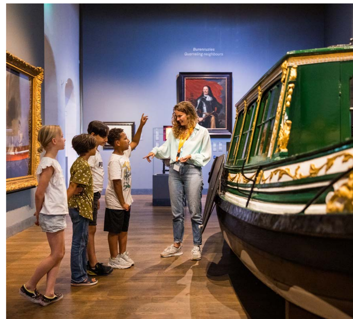
Schoolbezoek @ Twycer

De kosten van het blad Zeemagazijn bedroegen € 12.554 (€ 12.554). Het Jaarboek is afgelopen jaar niet uitgegeven. Overige kosten en onvoorzien, waaronder portiekosten, zijn gestegen naar € 16.608 (€ 10.250).