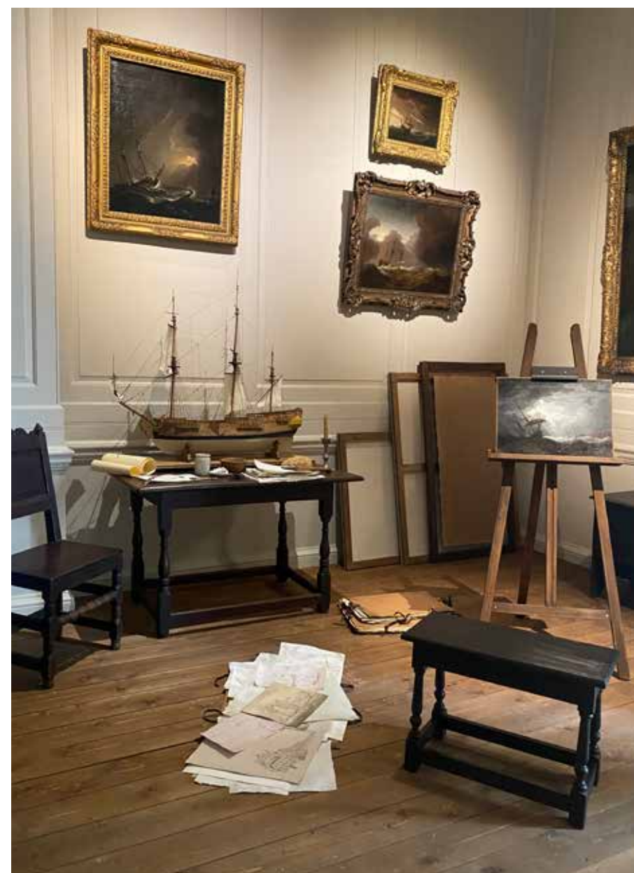
Bezoek Queens House, oktober 2023

Het tweejaarlijkse 'International Congress of Maritime Museums (ICMM) vindt in 2024 plaats in Nederland en België, waarvan twee dagen in Amsterdam. Dit is een meerdaagse conferentie i.s.m. het Zuiderzeemuseum, Maritiem Museum Rotterdam en MAS Antwerpen.