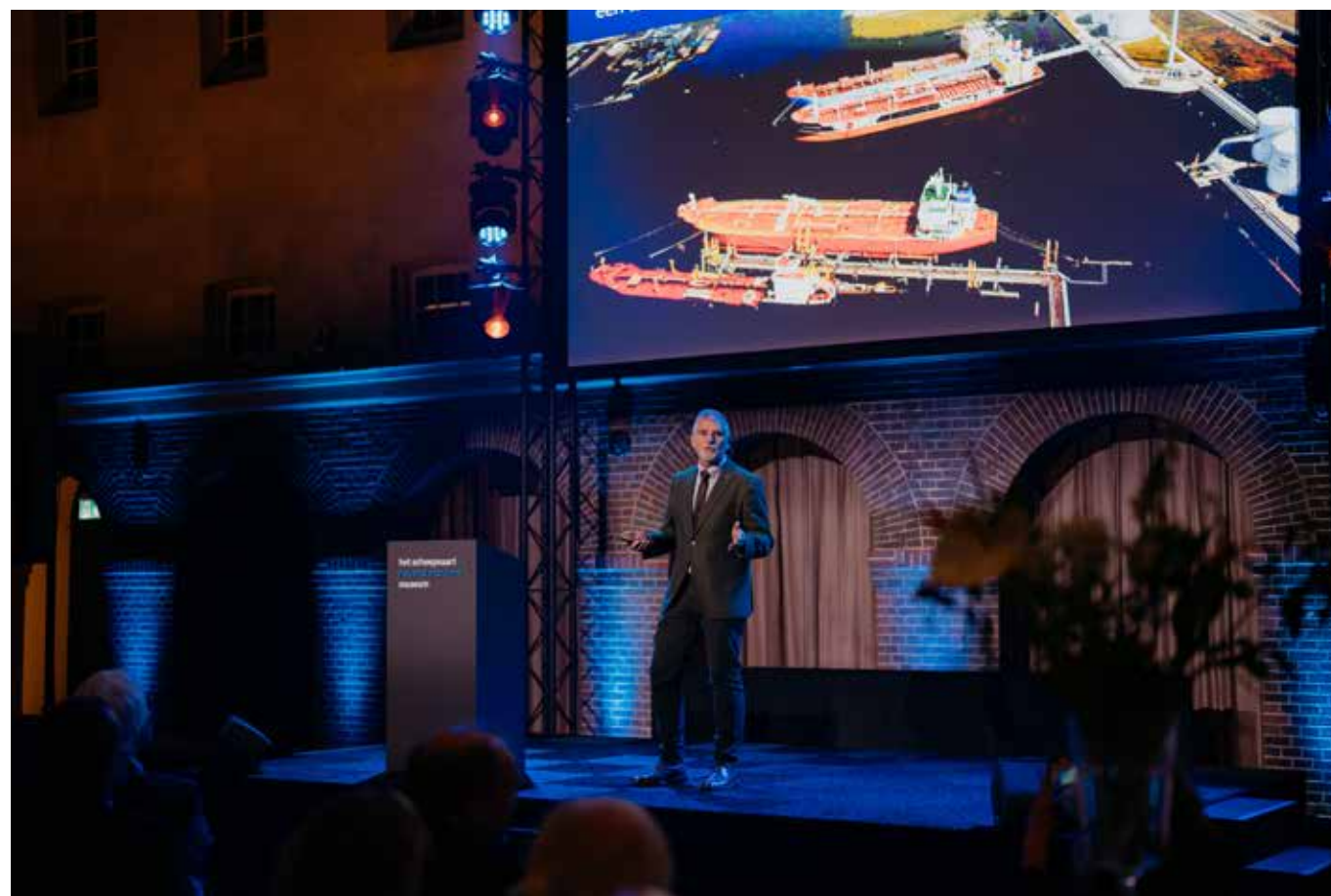
Jaardiner, november 2023

In het kader van de zichtbaarheid van de collectie hanteert het museum een genereus bruikleenbeleid. In het afgelopen jaar waren 135 voorwerpen in langdurig bruikleen bij 15 instellingen, waarvan er gedurende het jaar 7 objecten