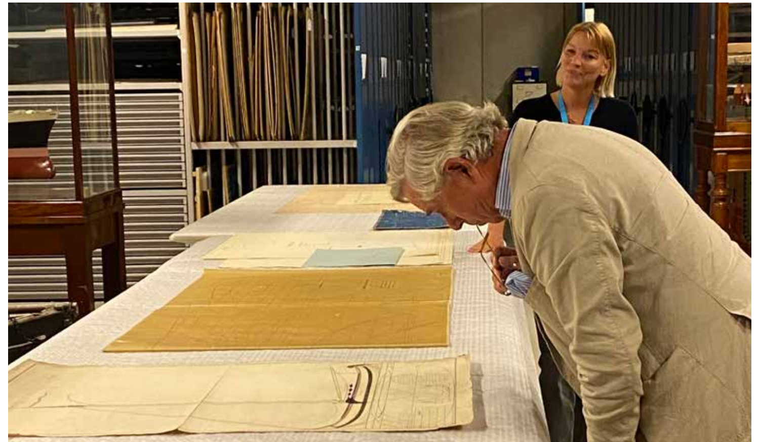
Bezoek aan het depot, september 2023

Ook de handschriftencollectie van Het Scheepvaartmuseum wordt in de komende periode gedigitaliseerd. De collectie manuscripten bevat meer dan 3.000 items, waaronder enkele zeer waardevolle en kwetsbare items. Er zijn vele originele scheepsjournalen en er is een belangrijke collectie 'leerboeken' in handschrift op het gebied van de navigatie. Zeer weinig instituten in Nederland verzamelen handschriften op het gebied