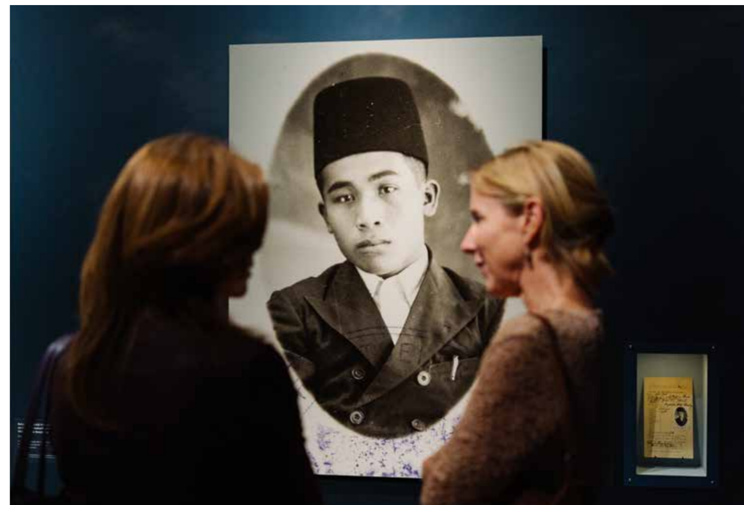
Mens op Zee.

De collectie van Het Scheepvaartmuseum staat centraal bij alles wat we doen. Tegelijkertijd vragen we onderzoekers, kunstenaars, ervaringsdeskundigen en onze bezoekers om te reageren op de hiaten in onze collectie en onze expertise. Met hun kunde en deskundigheid dragen ze blijvend bij aan de toekomst van het museum dat niet langer een toonzaal is, maar verandert in een levendige gemeenschapsruimte. Een meerstemmige plek dus, waar de maritieme cultuur ook wordt toegelicht en ingekleurd door rituelen, debat en uitwisseling van persoonlijke ervaringen. Omdat het verhaal van Het Scheepvaartmuseum niet alleen over schepen gaat, maar vooral over mensen.