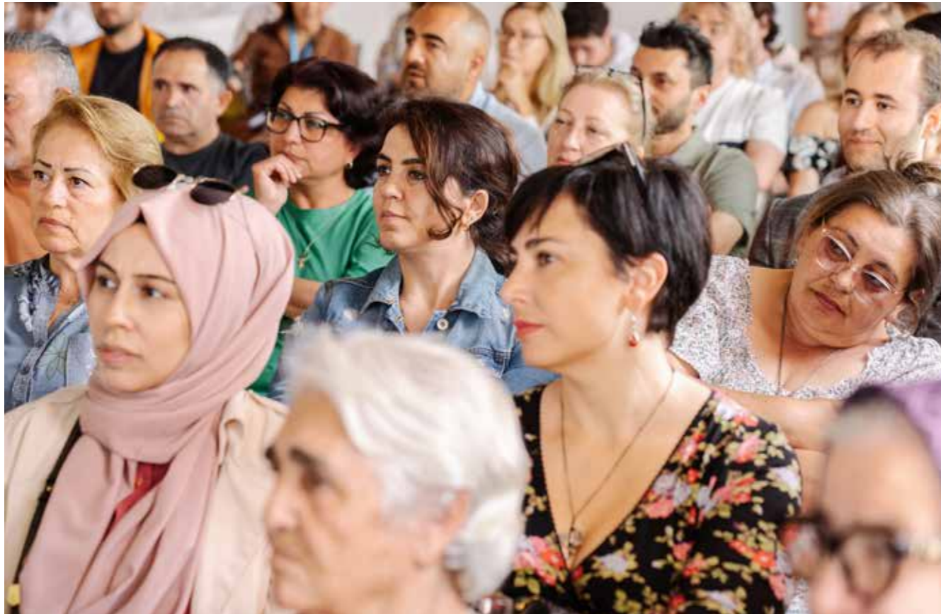
Bezoekers verhalen salon Baklava in Amsterdam Havenstad

en gesprek. Zo is het ook verwoord in de nieuwe museumdefinitie van ICOM (2023). 4 Die benadering vraagt om een andere aanpak en een andere manier van denken. Onderdeel daarvan is een ander perspectief op de bezoeker, die niet alleen gast, maar ook ervaringsdeskundige, expert en maker is.