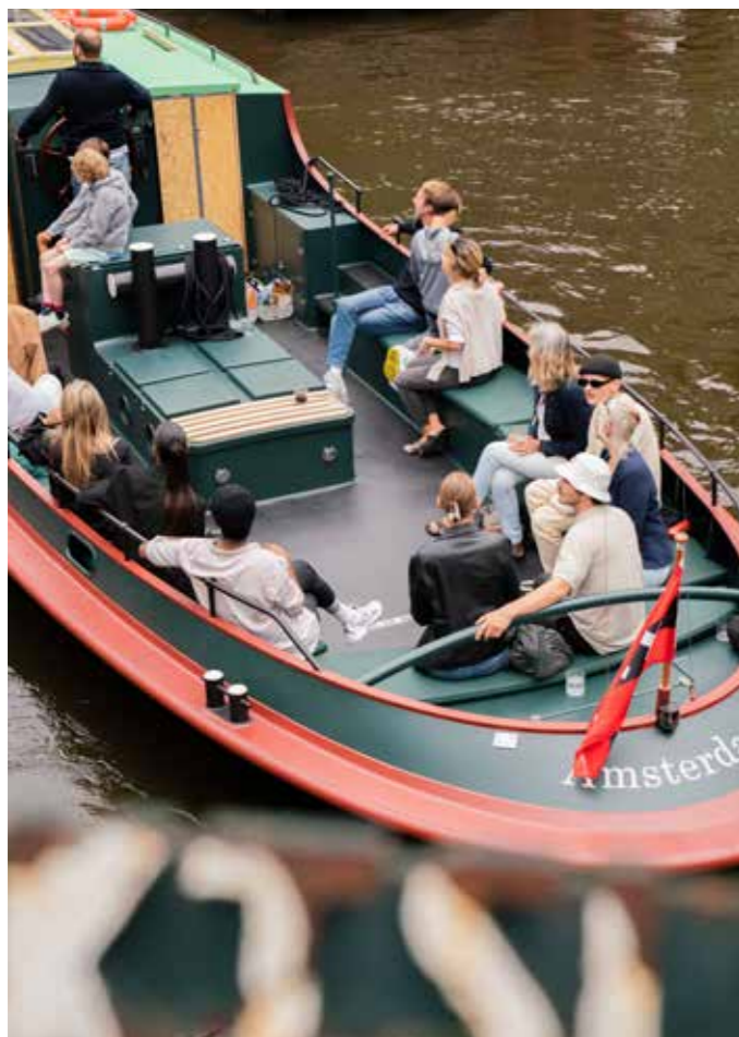
Cultuur Ferry.

Het Scheepvaartmuseum onderhoudt ook levendige contacten met de buurt en de stad. We konden de band met buurtbewoners en instellingen in de buurt extra aanhalen, omdat we de VriendenLoterij Museumprijs 2022 (thema: 'Beste buur') in ontvangst mochten nemen. Sinds april 2024 vaart de Cultuur Ferry waarvan Het Scheepvaartmuseum mede-initiatiefnemer was – de ferry maakt 32 culturele instellingen over water op een duurzame manier bereikbaar. Zo geven we op verschillende manieren vorm aan onze sociale verantwoordelijkheid en investeren we in cultureel ondernemerschap, publieksbinding en partnerschappen.