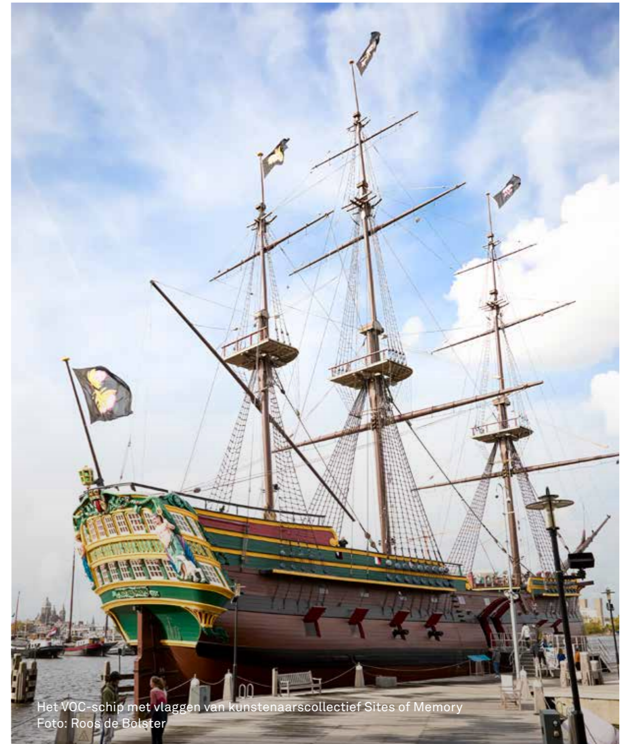
Het VOC-schip met vlaggen van kunstenaarscollectief Sites of Memory

In de Presentatieruimte aan het Open Plein tonen we recente aanwinsten en actuele onderzoeksresultaten.