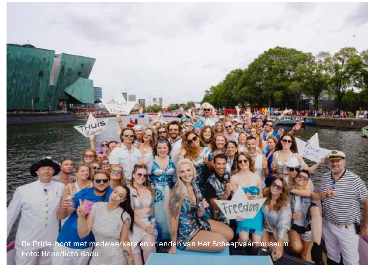
De Pride-boot met medewerkers en vrienden van Het Scheepvaartmuseum