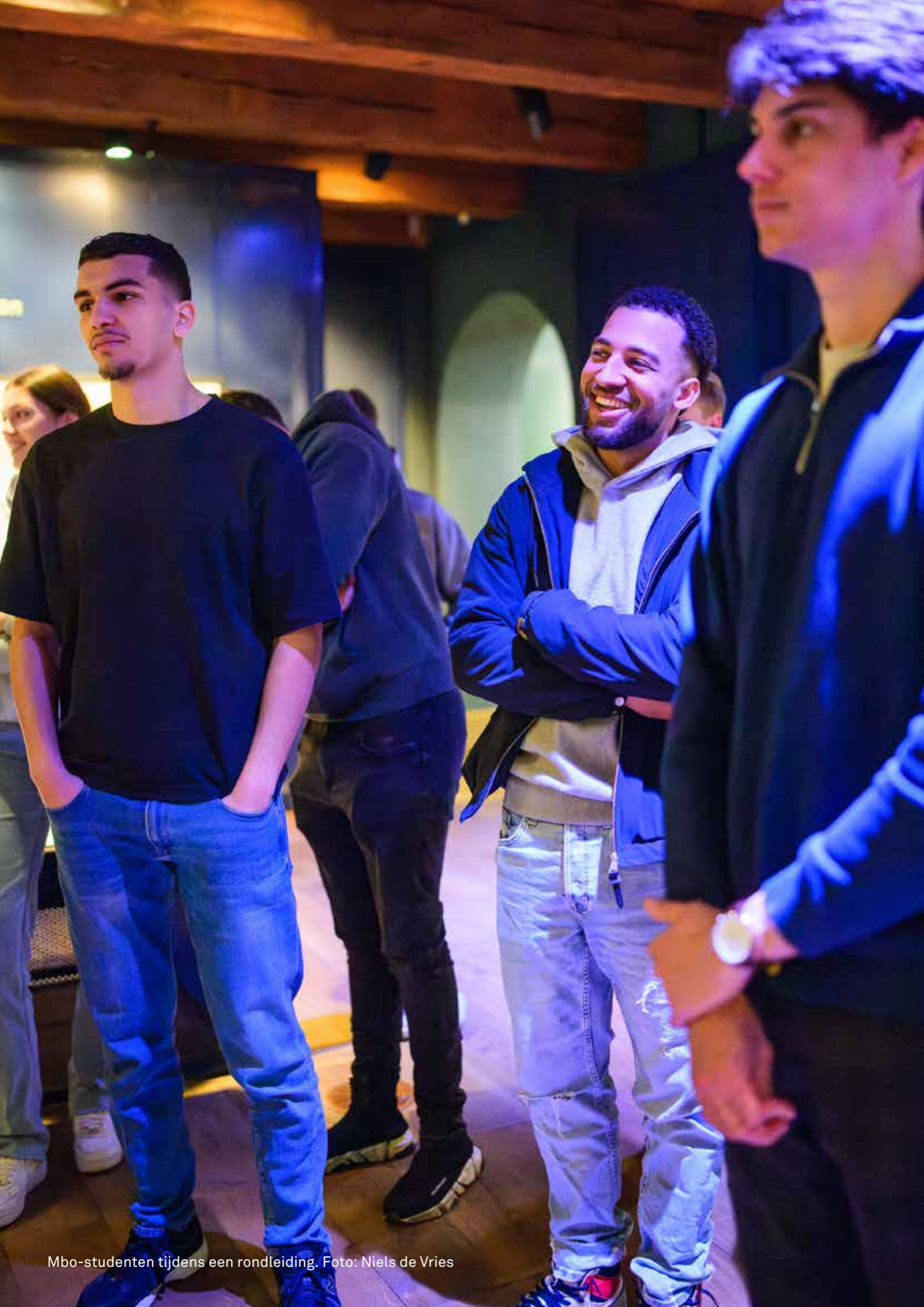
Mbo-studenten tijdens een rondleiding.