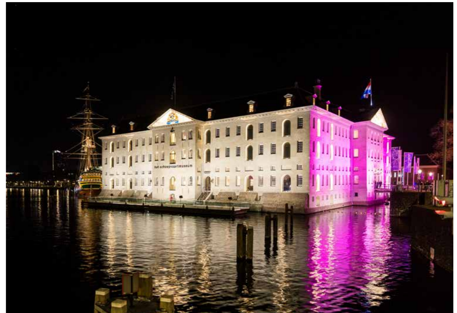
Het Scheepvaartmuseum kleurde roze tijdens Museumnacht 2024.