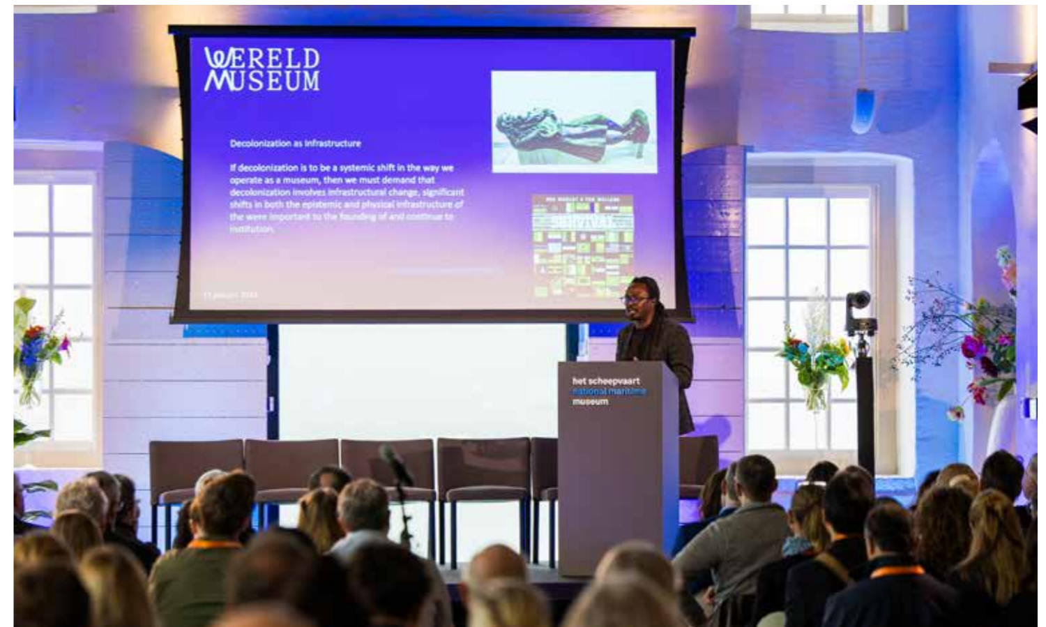
International Congress of Maritime Museums 2024 in Het Scheepvaartmuseum

We onderzoeken hoe we onze fondsstructuur effectiever en overzichtelijker kunnen maken in de vorm van één Het Scheepvaartmuseum Fonds. Dat doen we in samenspraak met Het Compagnie Fonds en de Vereeniging Nederlandsch Historisch Scheepvaart Museum.