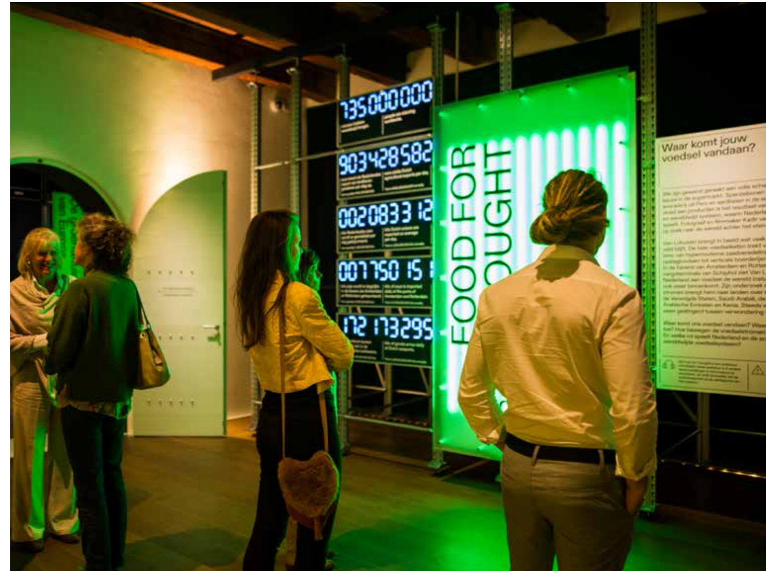
Food for Thought

Het Scheepvaartmuseum onderschrijft de Code Diversiteit & Inclusie, de Fair Practice Code en de Governance Code Cultuur. In onze jaarverslagen rapporteren wij over de naleving van de codes. Zij zijn een leidraad bij ons handelen. De inhoud van de codes is dan ook verweven in dit activiteitenplan: onze waarden en doelstellingen raken er bijna allemaal aan. In hoofdstuk 6 lichten we de drie codes verder toe.