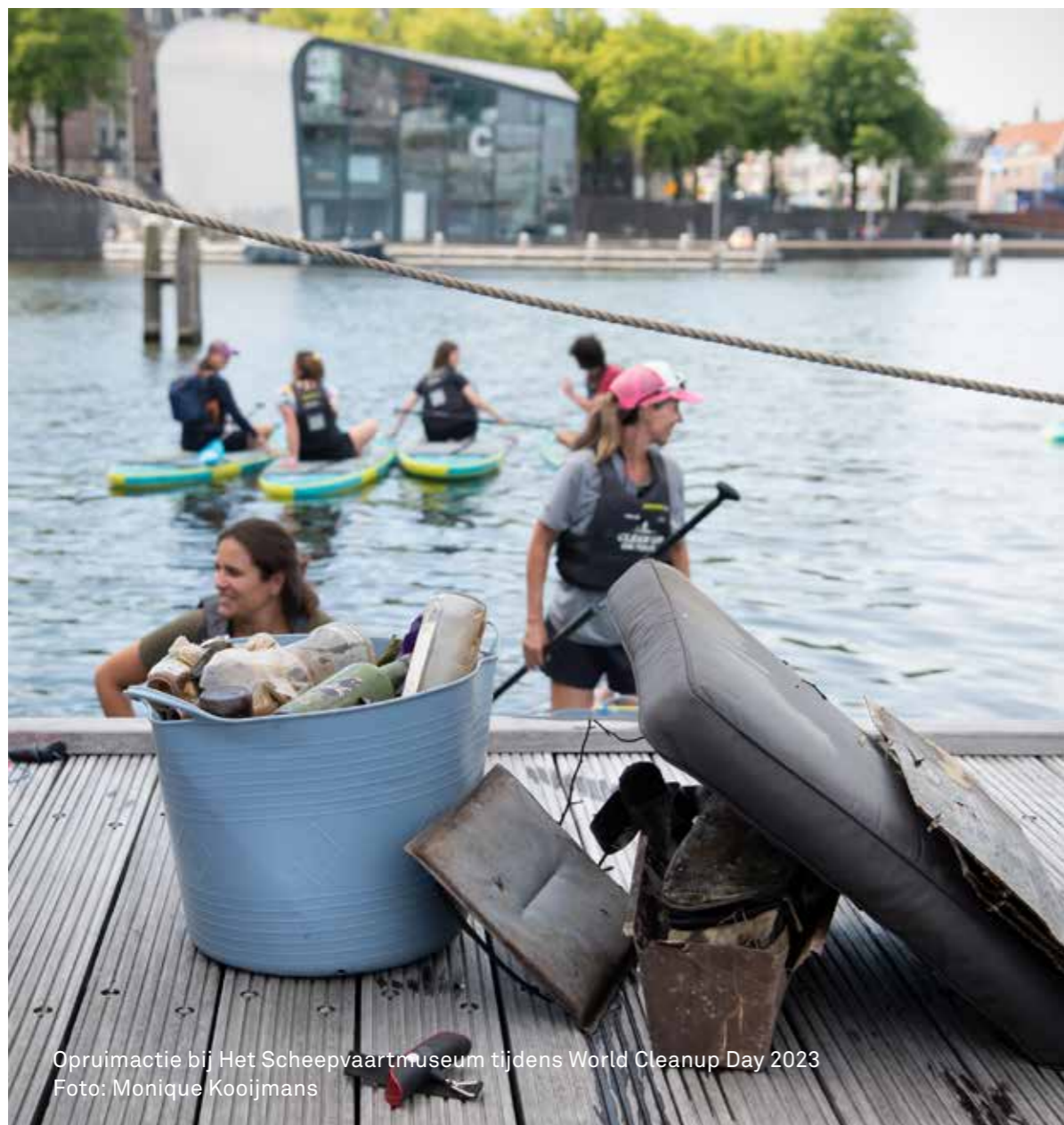
Opruimactie bij Het Scheepvaartmuseum tijdens World Cleanup Day 2023